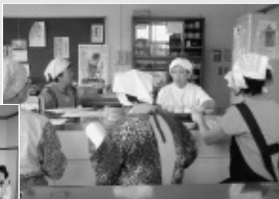
9/18 榎東合同 腹八分目班会 サラダうどん作り