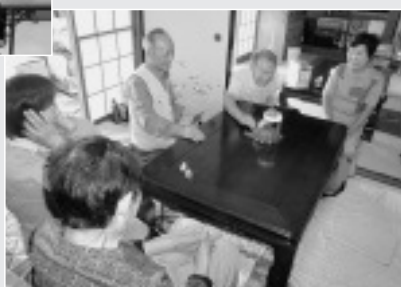
9/16 南有馬班会の健康体操