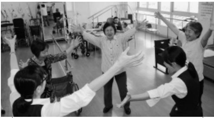
9/1 豊秋西浦班会 まずは20秒ワッハッハと声を出して笑ってみましょう

北毛保健生協初の笑いケア体操班会が豊秋西浦班にて始まりました。笑いケア体操とは、笑いヨガを医療福祉生協連版にアレンジしたものです。笑いを呼吸法として考え、無理に笑うのではなく、「ハハハ」としっかりと息をはいていきます。それに、動作を加えて、笑いに必要な筋肉「ゲラゲラ筋」を鍛えていきます。みなさんの支部でも班会に取り入れてみませんか？