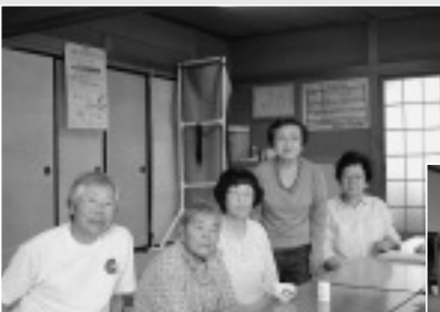
9/16 吉岡支部 ダンベル班会の様子