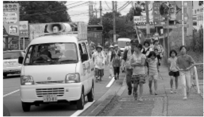
昨年7月5日伊香保、渋川市役所コース御蔭付近

※小野上⇒渋川市役所、沼田⇒子持⇒渋川市役所 (7/13) 渋川市役所⇒前橋市役所 (7/14) コースの詳細は6月号に掲載されています。