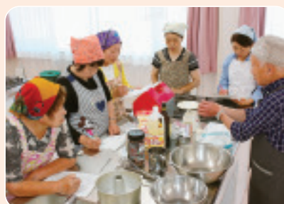
▲6/10 榛東合同班会 前理事長を講師に楽しくシフォンケーキ作り