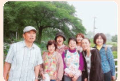
▲6/21 本石原班会 あじさい公園でウォーキング