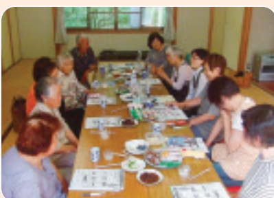
▲6/20 伊久保班会 人間ドック 地域で広がりますように