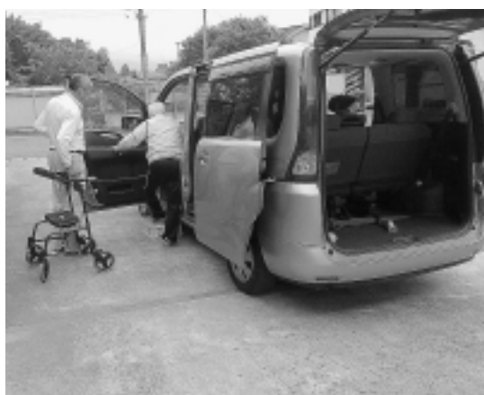
並木町利用者宅前