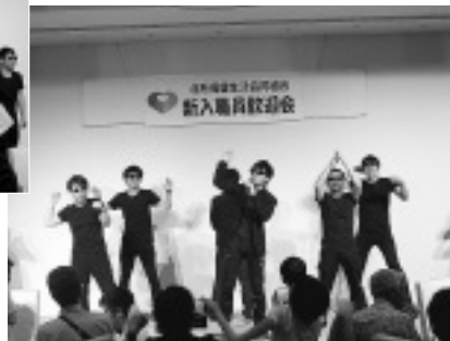
男性新人職員による出し物

う。リスクを分かつた上でそう選択する方を否定するつもりはありません。しかし、知らないために選択できないことはよくないと思つています。また、お酒やタバコは、本人が好きで始めたわけではなかったり、そのもの自体にある依存性