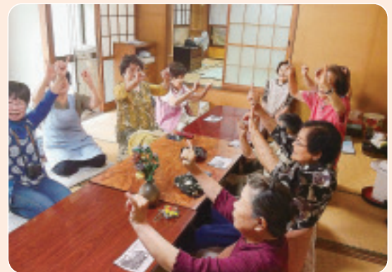
▲6/24 半田松原班会 脳トレでワッハッハ ワッハッハ 大笑い