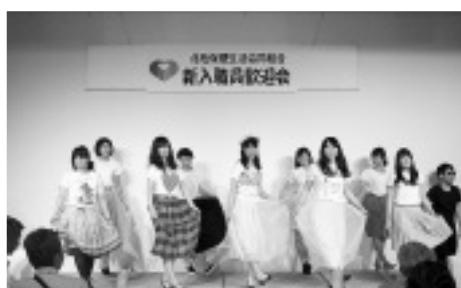
女性新人職員による出し物