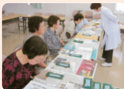
▲6/8 下中有馬班会 便潜血チェックと笑いケア