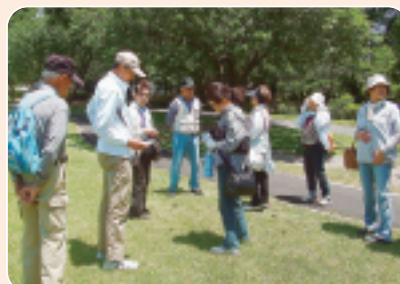
▲6/2 子持合同班会 白井宿で放射線測定