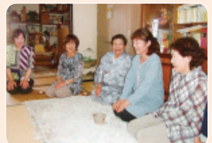
▲6/8 子持合同班会 『お茶の作法』なかなか難しい