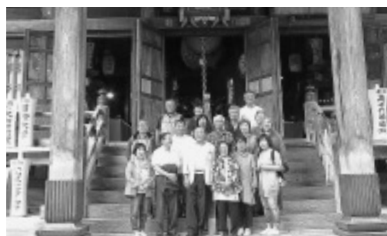
6/23 毘沙門堂の前で参加者全員集合

雨模様の中、新潟へスタート。 支部長と2人の理事が挨拶。 車内の中は明るく和やかな雰囲気。谷川岳PAへ到着、あの有名な「谷川6年水」が人気を集めています。 バスは関越道を進み浦佐毘沙門堂に到着。ガイドさんの案内により参拝、日光の陽明門を形どっている荘厳な山門をはじめ八方ニラミの龍・天女の舞絵姿・不動明王等次から次へと丁寧な説明を受けました。毎年3月3日の裸押し合祭りは雪の中壮大に行われるそうです。 続いて寺泊「魚のアメ横」角上へ、メニューの新鮮さ、溢れんばかりのボリュームはもちろん満足でした。金物の街、三条・洋食器センターではスプーンの製造工程を見学しました。 店内では食器や包丁など金物が勢揃いしている人もいました。