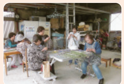
▲6/21 川島合同班会 ラベンダースティック作り