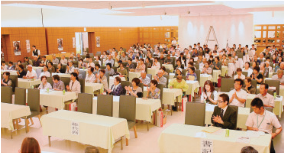
参加者から要望、質問多く出される

発行所 北毛保健生活協同組合 〒377-0005 渋川市有馬237-1 TEL 0279-24-2141 FAX 0279-24-8873 発行責任者 中澤 眞 理 編集責任者 くらしと医療編集委員会 印刷所 上武印刷株式会社