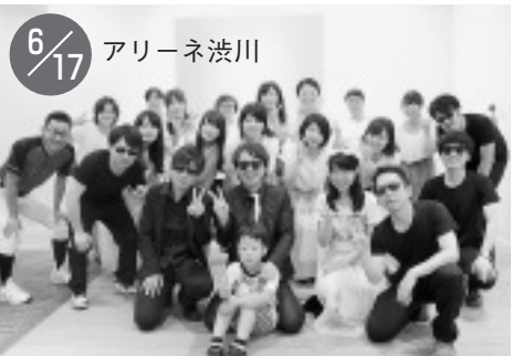
これからの北毛を支える19人の若い力

昨年6月から今年度6月までに北毛保健生協は28人の新入職員を迎えました。新しい職員とともに質の高い医療をめざします。