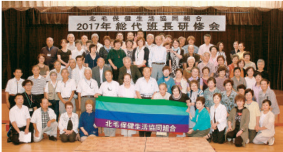
全行程終了後のインペリアルホールで

発行所 北毛保健生活協同組合 〒377-0005 渋川市有馬237-1 TEL 0279-24-2141 FAX 0279-24-8873 発行責任者 中澤眞理 編集責任者 くらしと医療編集委員会 印刷所 上武印刷株式会社