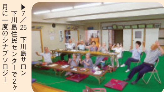
▶ 7/25 下川島サロン 下川島住民センターで2ヶ 月に一度のシナプソロジー