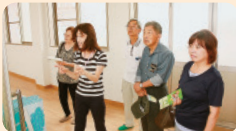
▼ 7/2 北橋支部合同班会 渋川市子育て支援総合センターと “ひなた”を見学