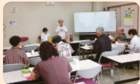
▲ 7/24 金島合同班会 配布調査と交流