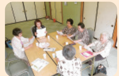
▲ 8/7 豊秋西浦班会 般若心経を読経