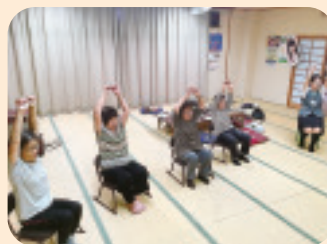
▲ 7/26 榛東支部 長岡一区 健康体操