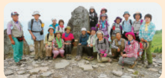
▲山の会 8/11の例会には19人が参加。出発時は、小雨でしたので天候を危ぶんでいましたが、晴れ男に晴れ女のおかげで比較的好天に恵まれ、美ヶ原を散策することが出来ました