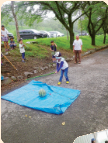
▲▲ 8/11 金島支部 群馬県憩いの森で木工 工作と渋川市総合公園で バーベキュー