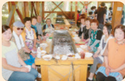
▲ 8/9 赤城支部 新総代さんの歓迎会を メイプルヴィレッジこも ちで開催