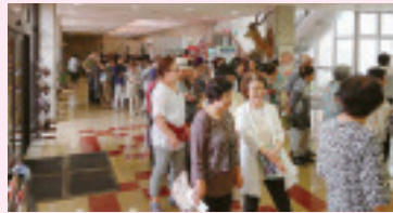
列をつくった大ホール前

8月8日に渋川市民会館大ホールで、三者協による平和映画会が行われました。今年は、話題作である「この世界の片隅に」。