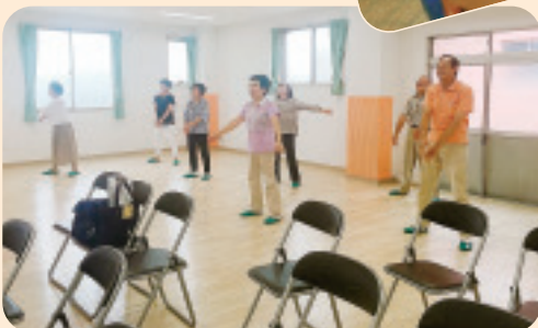
▲ 7/2 子持支部合同班会 “ひなた”の利用見学