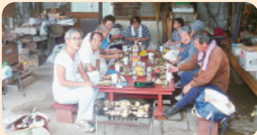
▶ 8/1 北橋支部 第二 班 暑気払い