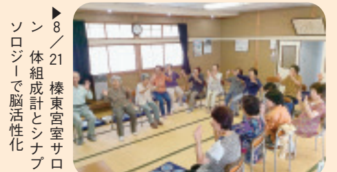
▶ 8/21 榛東宮室サロ ン 体組成計とシナプ ソロジーで脳活性化