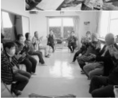
隣保館ミニデイサービス コスモス班