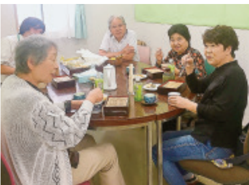
▲半田支部 病院生協コーナー終了後