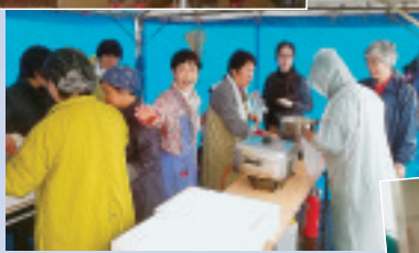
▲吉岡支部の中華まん