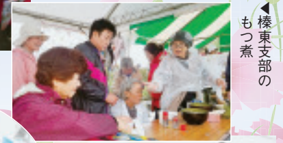
▲榛東支部のもつ煮