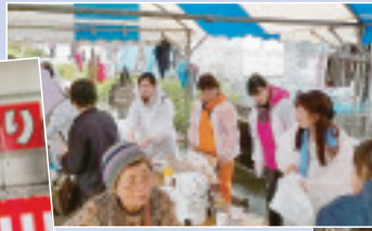
▲支援センター・スタッフによる喫茶コーナー