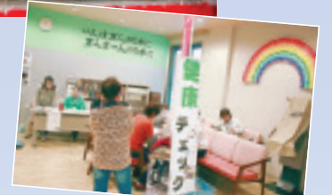
▲病院内で健康チェックを開催