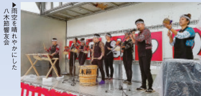
▶雨空を晴れやかにした八木節響友会