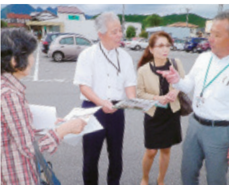
▲金島支部 金井南町地域を全戸訪問