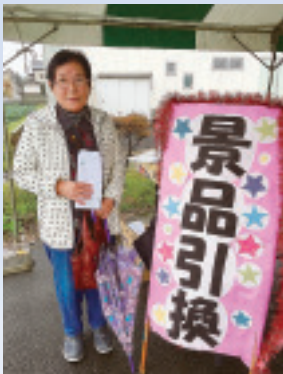
特賞 八木原のUさん