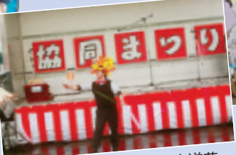
▲マッキーさんによる大道芸