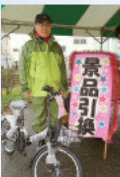
1等 自転車 みなかみ町のTさん