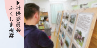
▶社保委員会 ふくしま視察