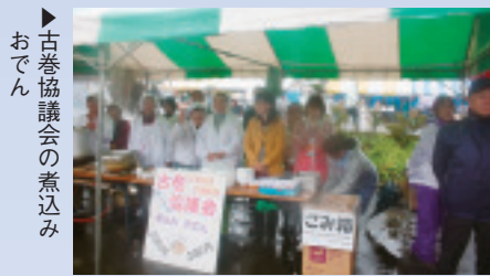
▶古巻協議会の煮込みおでん