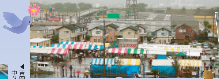
病院から見た協同まつり全体