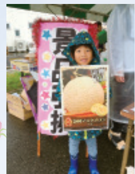
1等 高級メロン 安中市のWさん