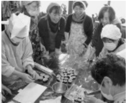
絵巻き寿司づくり

を定例にしています。気楽に集まれる居場所になっていくといいな、と思います。隣保館ミニデイサービス コスモス班