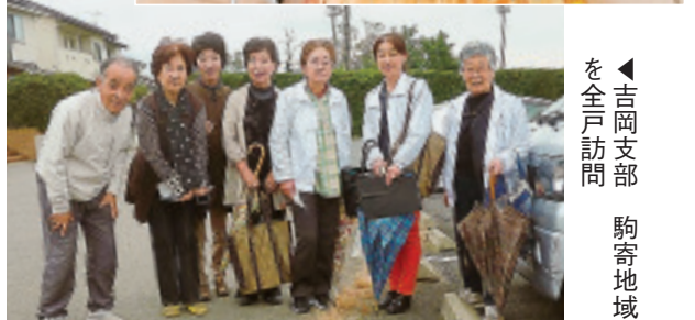
▲吉岡支部 駒寄地域を全戸訪問