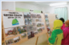
▲組合員ホール内の山の会展示