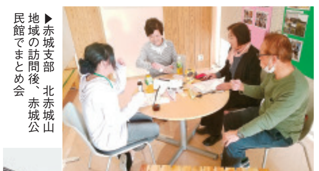
▲赤城支部 北赤城山地域の訪問後、赤城公民館でまとめ会