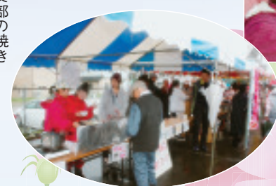
▲青年ジャンボリーのとり団子スープ