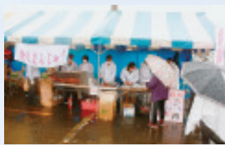
▲赤城支部の焼きまんじゅう