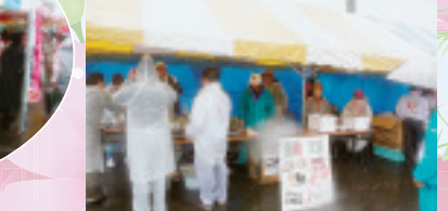
▲豊秋支部のいなりずしとフランクフルト