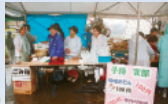
▲子持支部の味噌おでん