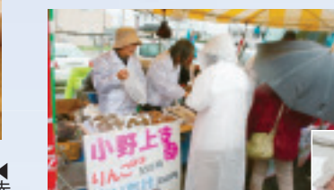
▲小野上のりんご舞たけ