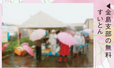
▲金島支部の無料すいとん