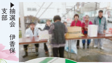
▶抽選会 伊香保支部