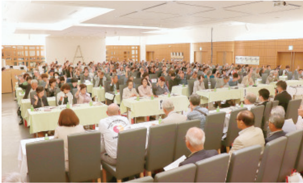
プレヴェール渋川 2階会場

発行所 北毛保健生活協同組合 〒377-0005 渋川市有馬237-1 TEL 0279-24-2141 FAX 0279-24-8873 発行責任者 中澤真理 編集責任者 ぐらしと医療編集委員会 印刷所 上武印刷株式会社