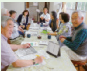
▲市街地合同班会 西部地域包括支援センター 見学