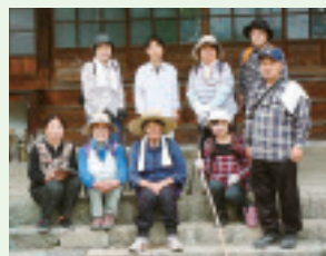
▲上有馬神戸班会 茂沢ダムまでウォーキング