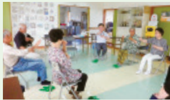
▲吉岡コスモス班会