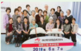
▲榛東支部お楽しみ企画 味の素工場見学。