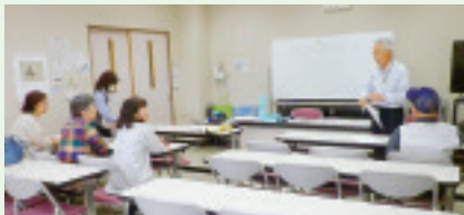
▲金島合同金井地域 配布者班会