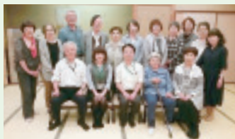
▲金島組織担当者 歓迎班会