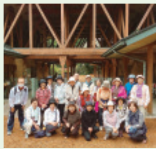
▲赤城支部合同 赤城自然園でウォーキング班会