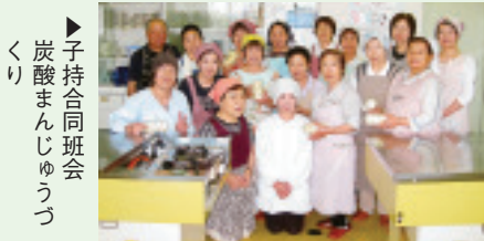
▲子持合同班会 炭酸まんじゅうづくり