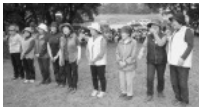
女性の部 左から上位10人