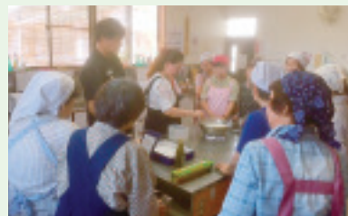
▲教育文化委員会講師 養成講座 杏仁豆腐づくり