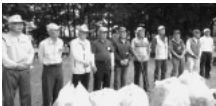
男性の部 左から上位10人