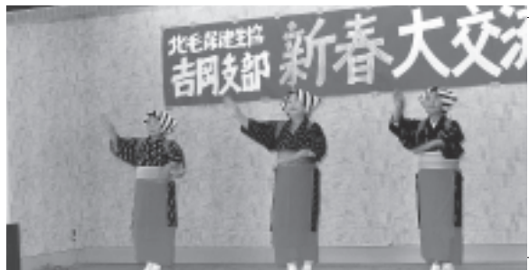
新春のつどいのようす

などを実施。家も人も増えている吉岡町、生協の目的である人と人とのつながりをもっと広