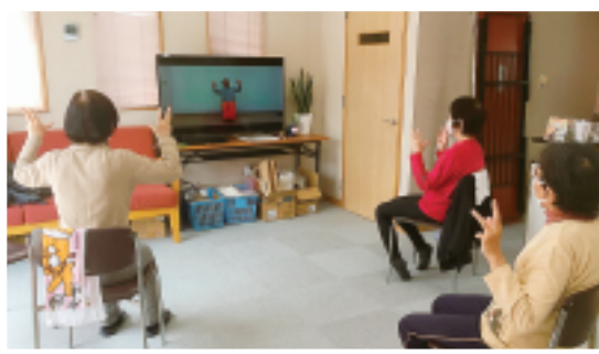
市街地支部 木曜レインボウ