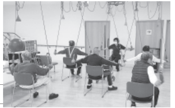
レッドコードを使用したリハビリのようす

め、市内のケアマネジャーへ施設の紹介を行っているところですが、施設内は渋川市内で初めて導入されたレッドコードを始め、様々なリハビリ機器を揃えており、さながらスポーツジムの様相です。体幹の強化や筋力増強、疼痛緩和のためのリハビリを実施しています。随時ご相談を受け付けていますので、気軽にお問い合わせください。