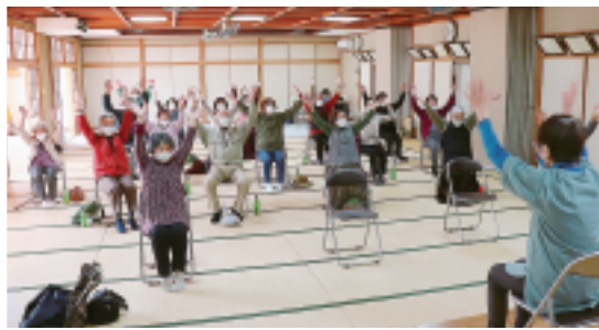
半田支部 新春のつどい