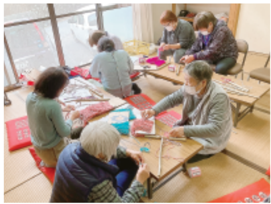
小野上支部 モップづくり