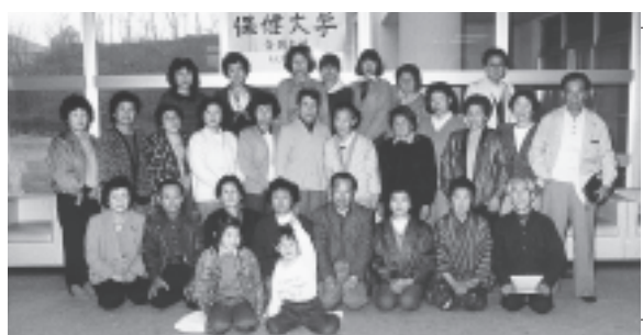
支部で開校した保健大学