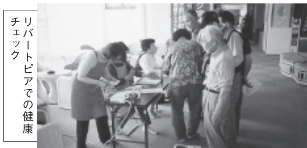
リバートピアでの健康チェック

などを実施。家も人も増えている吉岡町、生協の目的である人と人とのつながりをもっと広