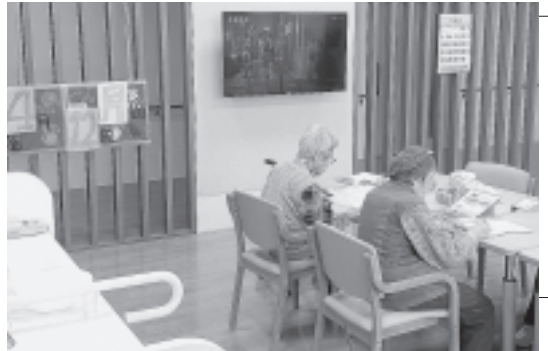
ユニットのようす

併設している通所リハビリは、午前と午後の2部制となっており、昼食と入浴のサービスはありません。まだ利用者数が少ないため、市内のケアマネジャーへ施設の紹介を行っているところですが、施設内は渋川市内で初めて導入されたレッドコードを始め、様々なリハビリ機器を揃えており、さながら