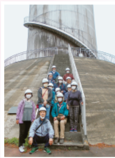
北橘支部 佐久発電所見学