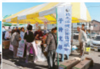
▲子持支部の味噌おでん