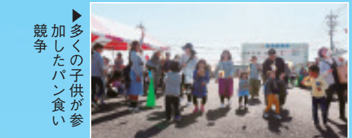
▶多くの子供が参 加したパン食い 競争