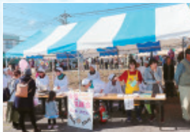
◀古巻協会の煮込みお でん