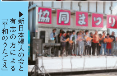
▶新日本婦人の会と 有志の方による 「平和のうたごえ」