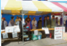
◀吉岡支部の中華 まんじゅう