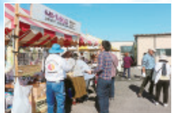
◀金島支部のすいとん