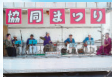
▲ドリームスターズによるバンド演奏