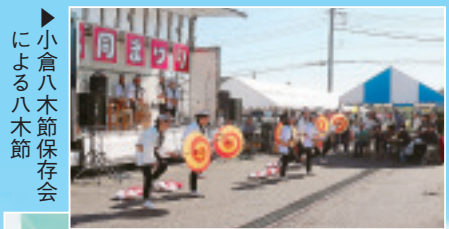
▶小倉八木節保存会 による八木節