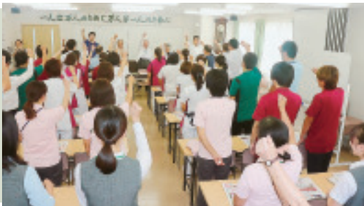
10月1日に組合員ホールで行われたスタート集會

北毛病院では正面玄関に入ったすぐ脇に生協コーナーがあります。そこでは地域の組合員が加入、増資のお願いだけでなく、相談窓口として活動しています。強化月間中は職員も生協コーナーに立ち一緒に行動しています。