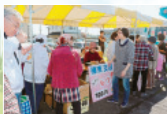
◀榛東支部のもつ煮