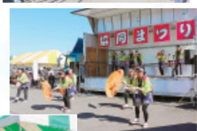
◀半田八木節保存会によ る八木節