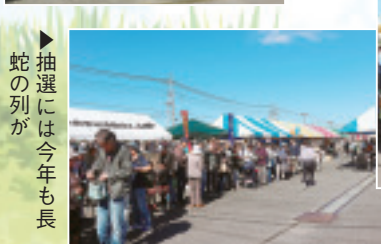
▶抽選には今年も長 蛇の列が