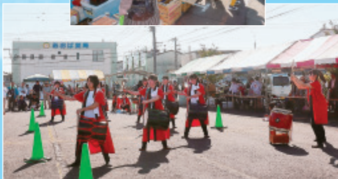
▲青翠高校和太鼓部による演奏