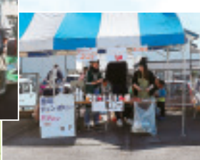
◀青年職員による ポップコーン