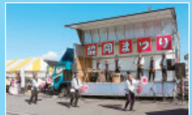
◀中村八木節響友会に よる八木節