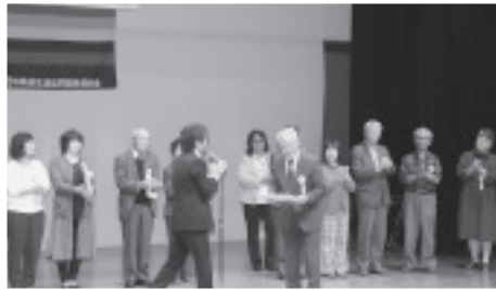
健康チャレンジなどこの間の活動を表彰された「健康づくり部会」

健康づくりを行った赤城支部。そして、この間健康チャレンジやウォーキングイベント、保健学校同窓会など健康づくりに取り組む仲間を増やすため多くの企画を考え、実行した健康づくり部会が団体表彰を受けました。あわせて、勤続30・15年の職員表彰がありました。