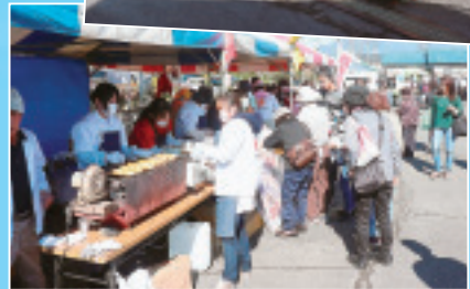
◀赤城支部の焼き まんじゅう