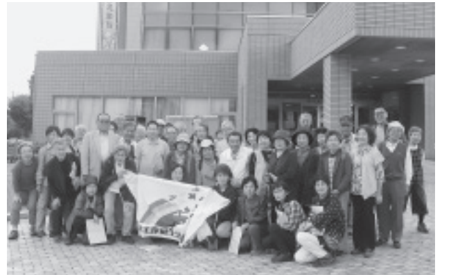
浪江町役場の前で集合写真

「今の不便な生活を楽しんでいきます。被災前の生活は、便利すぎていただけで、工夫して自分で生活すればいいのです。」という逞しい言葉でした。しかし、原発そのものが無ければ、今まで通り生活ができていたのだと思います。原発がなくて