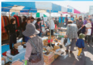
◀社保委員会による バザー