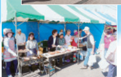
◀豊秋支部のいなり ルと 寿司とフランク ル