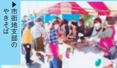
▶市街地支部の やきそば