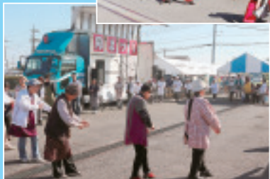
◀参加者たちで 民謡踊り