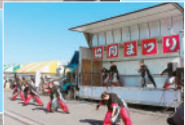
▶中村ソーランスに よる南中ソーラン