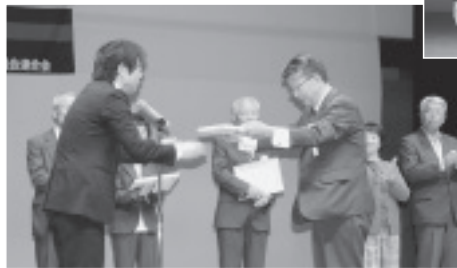
地域のサロンと連携し、定期的に健康づくりを行い表彰された「赤城支部」