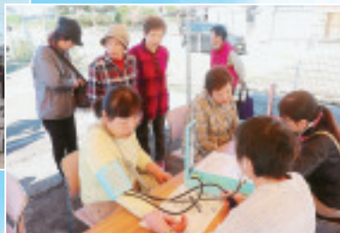
▲職員による青空健康チェック