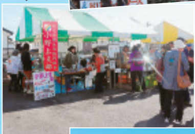
◀小野上支部のりんご、 舞茸販売