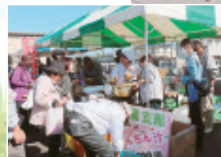
▲北橋支部のけんちん汁