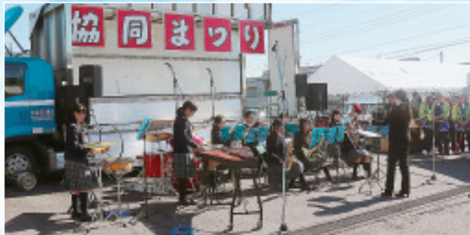
▲青翠高校吹奏楽部による演奏