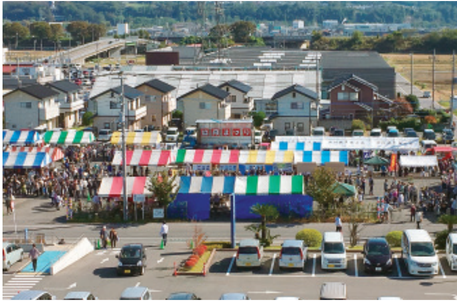
2,300人が集う協同まつり

発行所 北毛保健生活協同組合 〒377-0005 渋川市有馬237-1 TEL 0279-24-2141 FAX 0279-24-8873 発行責任者 中澤真理 編集責任者 くらしと医療編集委員会 印刷所 上武印刷株式会社