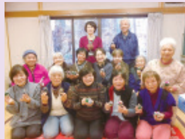
小野上合同班会 ミニクリスマスツリーづくり