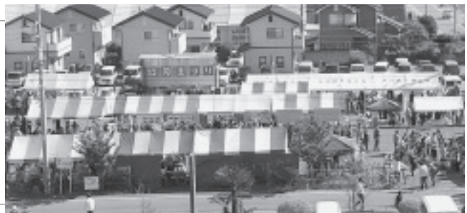
2300人が集まった協同まつり

ジ企画が行われ、演奏も好評で大盛況のまつりとなりました。その他にも各支部で様々な取り組みが行われ、非常に充実した月間となりました。ご協力いただきましたありがとうございます。