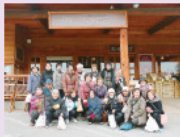
吉岡支部旅行 りんご狩りと軽井沢探索