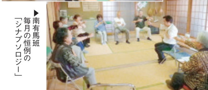
▶南有馬班 毎月の恒例の「シナプロロジー」