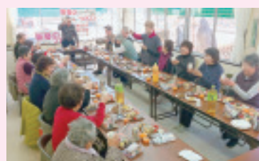
金島支部 1月11日 老人福祉センターにて 参加21名