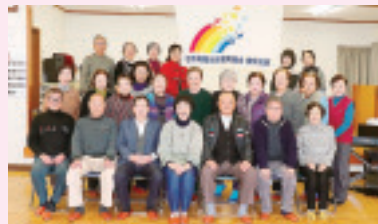
豊秋支部 1月20日 豊秋公民館にて 参加27名