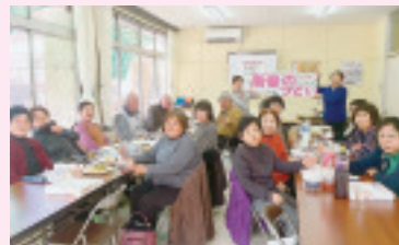
八木原支部 1月25日 老人福祉センターにて 参加17名