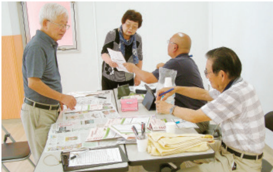
塩分チェックの様子

発行所 北毛保健生活協同組合 〒377-0005 渋川市有馬237-1 TEL 0279-24-2141 FAX 0279-24-8873 発行責任者 中澤真理 編集責任者 くらしと医療編集委員会 印刷所 上武印刷株式会社