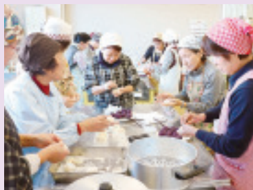
子持合同班会 紅芋まんじゅうづくり