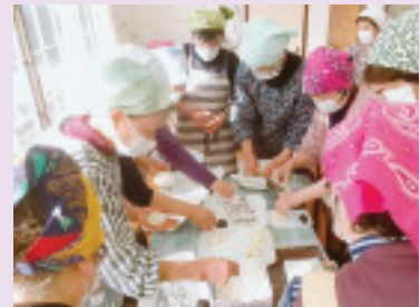
講師養成講座 中華まんづくり 中華まん

近くには「入沢集落発祥の地」や「渋川城址」の碑(入沢城址)があります。興味のある方はご覧になってください。(聞き手 中澤 勤)