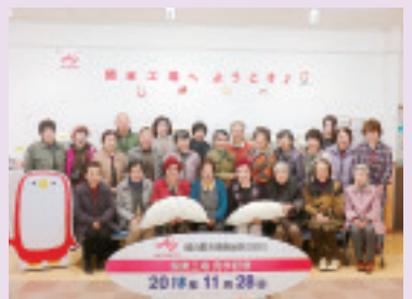
半田支部旅行 味の素工場見学