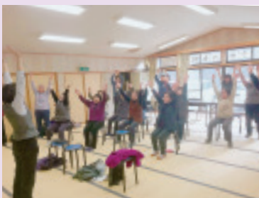
伊香保支部つどい 笑いケア