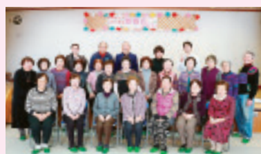
有馬支部 1月24日 有馬會館にて 参加26名