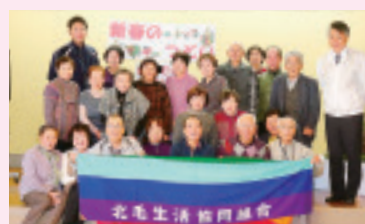
北橋支部 1月23日 しろやま荘にて 参加26名