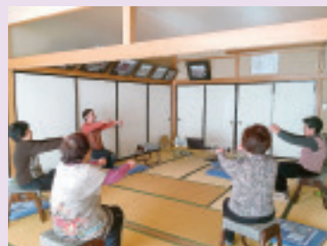
八木原北班 レインボー体操