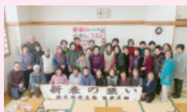
榛東支部 1月20日 しんとう温泉にて 参加39名