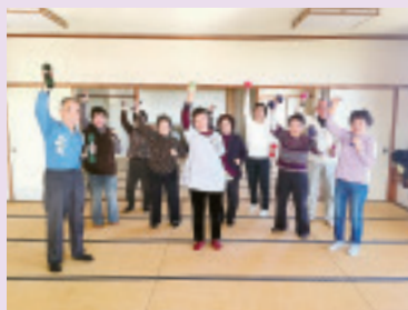
吉岡支部ダンベル班 ダンベル体操