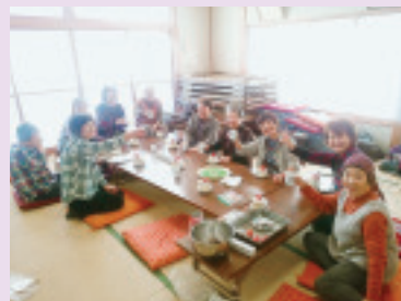
半田合同班会 クリスマスケーキづくり