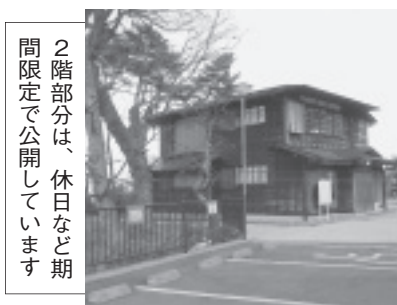
2階部分は、休日など期間限定で公開しています