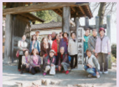
子持支部旅行 上毛かるたを巡る旅「碓氷峠の関所跡」