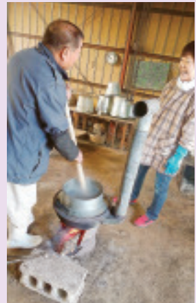
豊秋支部澤浦班 こんにゃくづくり