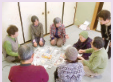
豊秋支部西浦班 尿塩分チェック