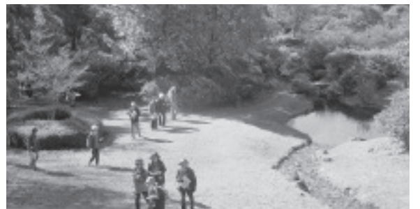
赤城自然園でのウォーキングイベント

した。今回は月間の特典もあったため、多くの方の加入、増資につながったのではないかと思います。月間中に行った、第2回ウォーキングイベントでは赤城自然園にて116名の参加で開催されました。昼食には「ほくもう減塩弁当」もお披露目されました。まさに楽しく健康づくりとあった企画だったのでないかと思えます。協同まつりは好天にも恵まれ、約2300人もの方が集まりました。まつり史上初めての高校生のステ