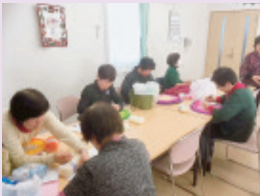
講師養成講座 編み物「円座づくり」