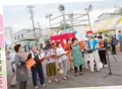
▶新日本婦人の会の方たちによる平和のうたこえ