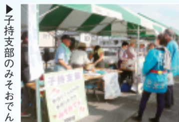
▶子持支部のみそおでん