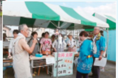
◀吉岡支部の中華まん