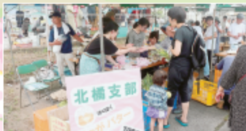
▲北橋支部のじゃがバター