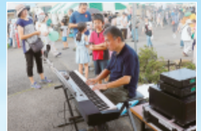
◀会場には素敵な音色が