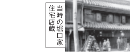
当時の堀口家住宅店蔵