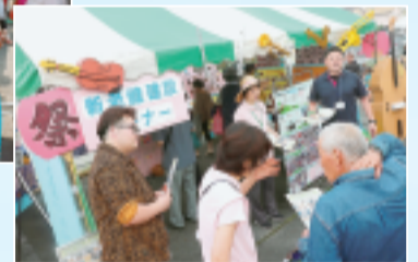
▲老健建設に向けた宣伝コーナー