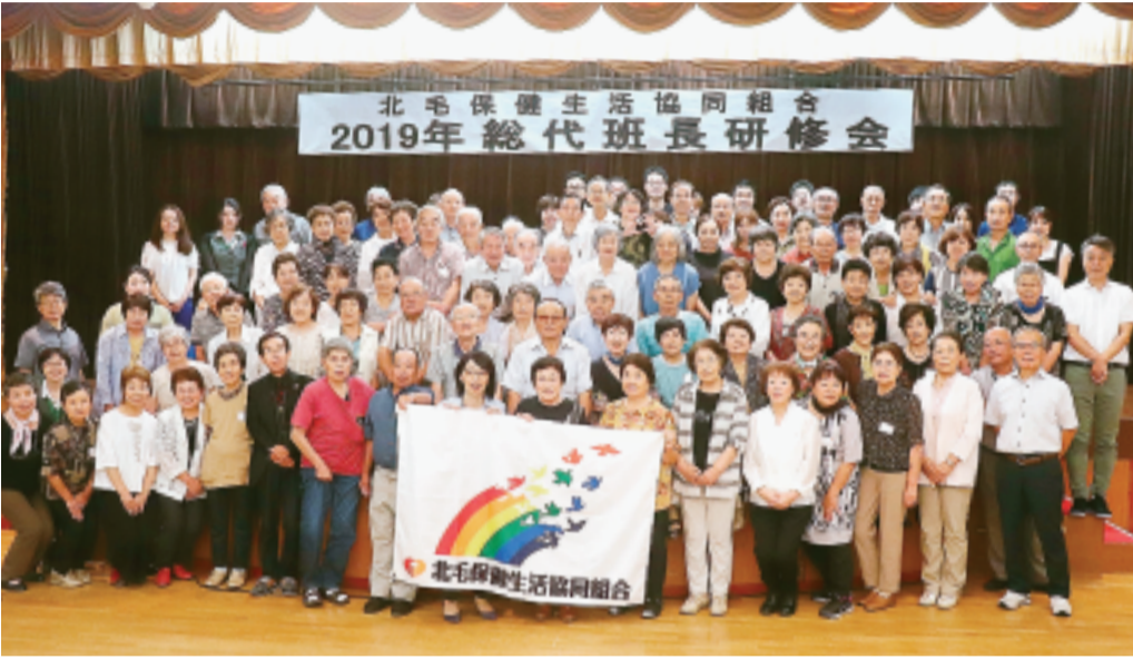
参加者全員での集合写真

8月30日～31日に毎年恒例の「総代班長研修会」を伊香保温泉ホテル天坊にて開催しました。 今年度は、「生協を大きくつよく、健康づくり生協をひろげよう」というテーマのもと、総勢145名が参加しました。