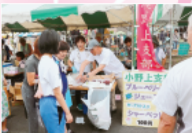
▲小野上支部のブルーベリーソーダ・シャーベット