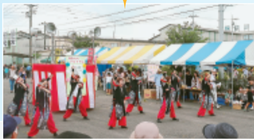
◀中村ソーランズのみなさん(職員)