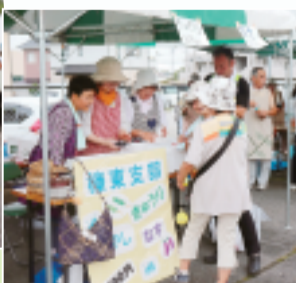
◀榛東支部の冷やしきゅうり・なす