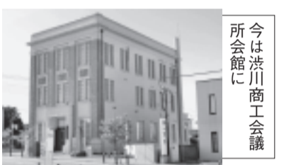
今は渋川商工会議所会館に

26(年)4月に曳家(ひきや)移動で北東に5メートルほど移動しています。堀口家住宅(みせぐら)堀口家住宅は渋川市上ノ町に位置している古民家です。堀口家は江戸時代初期の1629(寛永6)年に三國街道渋川宿で創業した老舗金物店です。