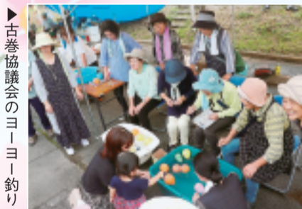
▶古巻協議会のヨーヨー釣り