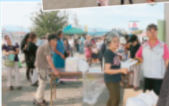
▲抽選担当の伊香保支部