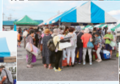
▲生協社保委員会によるバザー