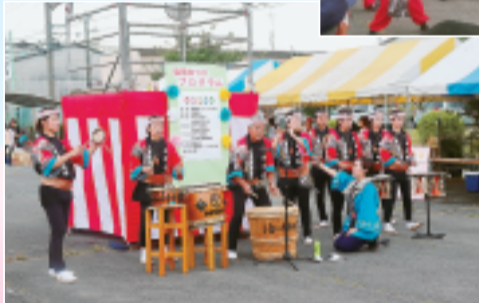
▶小倉八木節保存会のみなさん