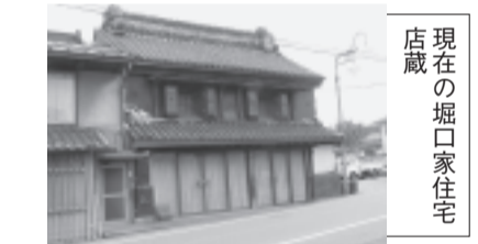
現在の堀口家住宅店蔵

小売を開始し、戦後は度量衡、高圧ガス、溶材といった部門の営業を加えました。1949(昭和24)年に「株式会社堀口商店」となりました。