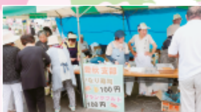
▲豊秋支部のいなりずしとフランクフルト