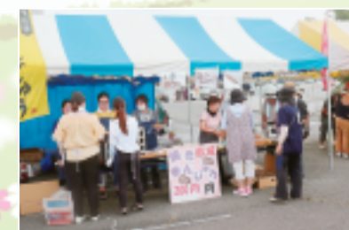
◀赤城支部のやきまんじゅう