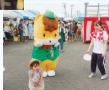
▲今年ぐんまちゃんも来てくれました