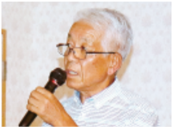
小野實組合員活動委員長

護事業部長より、老健の役割や運営方針などの説明がされました。実際に起こった事例を紹介し、老健の活