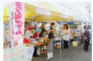
◀市街地支部のやきそば