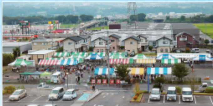
▲協同まつり会場のようす