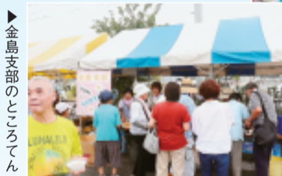
▶金島支部のところてん