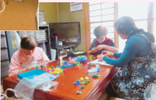
赤城支部 いちご班 折り紙