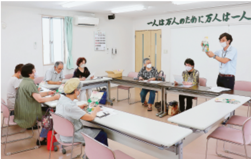
地域訪問前の学習会と作戦会議のようす (吉岡支部)

吉岡支部では、新しい 住宅がたくさんできてお り、若い世代にも北毛保 健生協の良いところを知っ