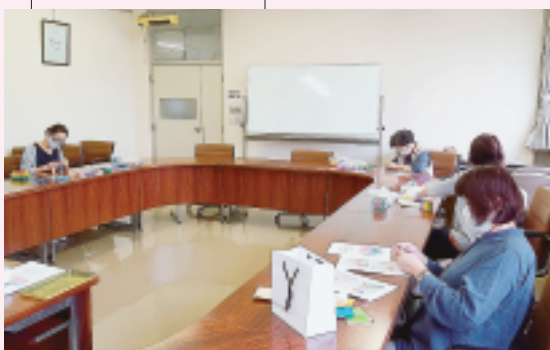
北橋支部 合同班会 折り紙