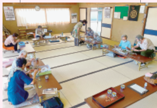
半田支部 新屋敷前河原班会 便潜血チェック・ ハーバリウムづくり