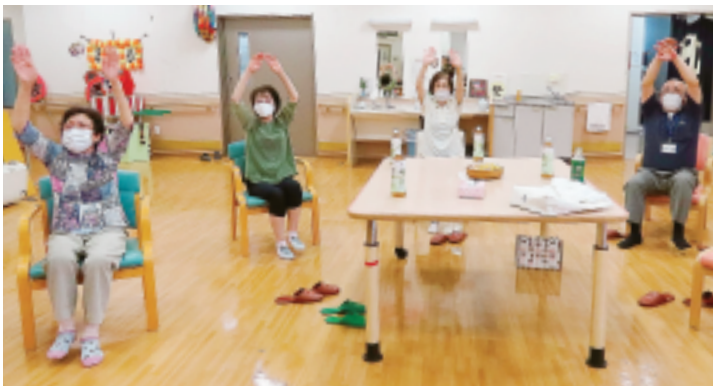
7月からはじめた「木曜レインボウ」 (市街地支部)

力のお祝いと日頃の感謝の 気持ちで直接伝えるため、 「配布者宅訪問」に取り組 みました。