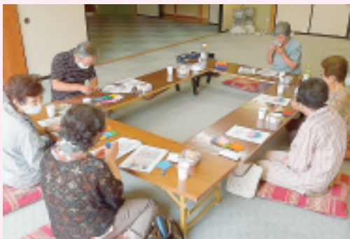
豊秋支部 西浦班会 折り紙