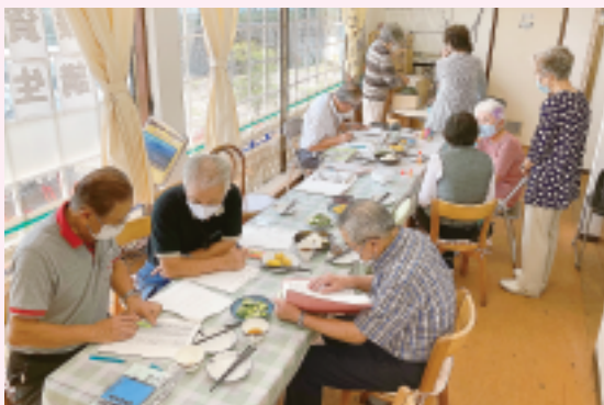
金島支部 カフェあじさい