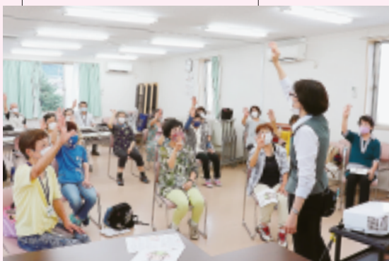
健康づくり・教育文化委員会 コロナにまけるな体操学習会