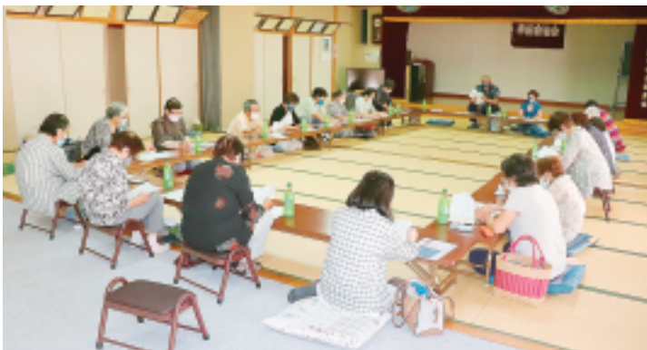
会議は22人も配布者が集まりました (半田支部)

例年、各支部では配布者 さんの「配布者慰労会」な どを行っていましたが、今 年はコロナ禍のため中止と なってしまいました。なに か「新しいかたち」で少し でも配布者さんたちに感謝 の思いを伝えたいと、工夫 を凝らし様々な活動に取り 組んでいます。 有馬・伊香保支部では記 念品を携え、強化月間の協