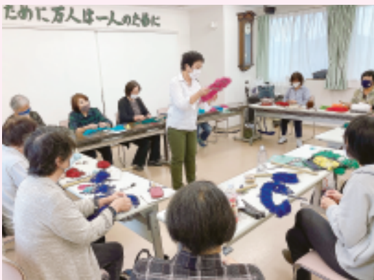
教育文化委員会 モップづくり教室