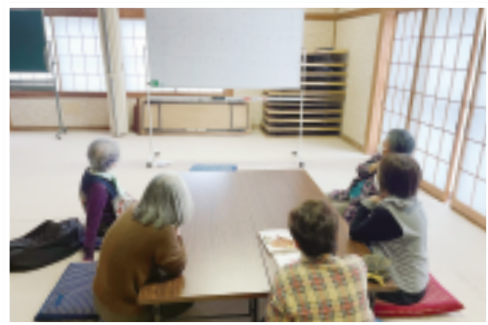
子持支部 ひばり班会