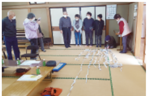
有馬支部 上有馬神戸・南有馬合同班会