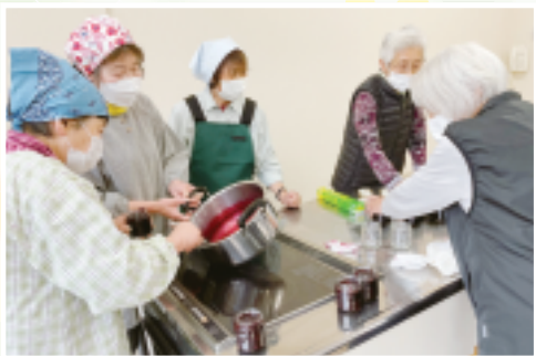
小野上支部 手芸クラブ