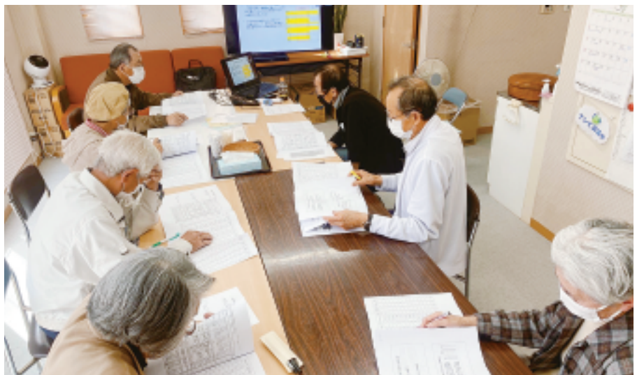
ケアプランセンターほくもう2Fでの分散会のようす

久しぶりの組合員同士の交流の場だったため、各会場でグループディスカッションは終始盛り上がりま