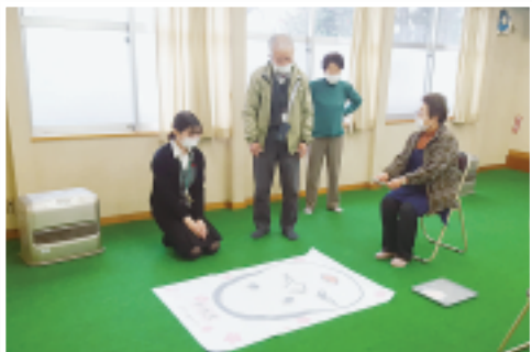
金島支部 下川島サロン