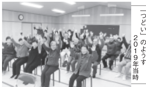
「つどい」のようす 2019年当時

今後も伊香保支部では「伊香保支部つどい」を中心に誰もが健康で居心地よくくらしをまっすぐりをめざして活動していきます。