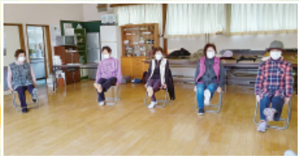
赤城支部 バラの会