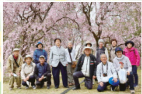
豊秋支部 合同班会