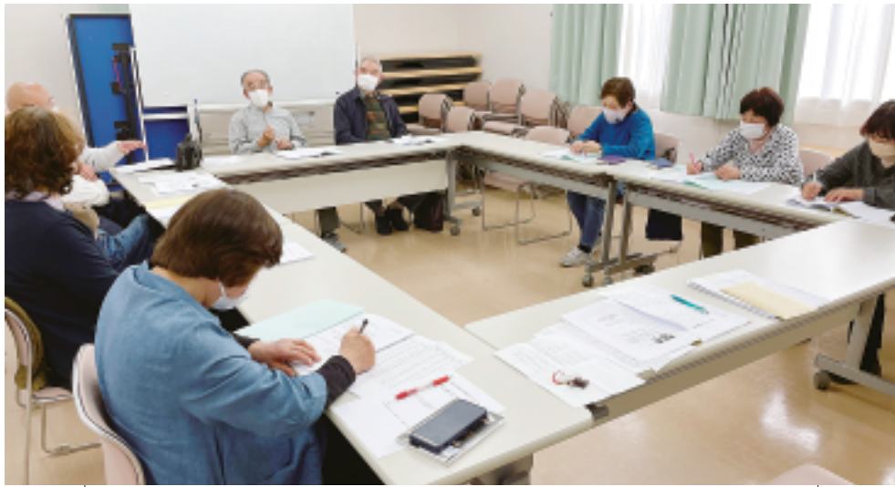
組合員ホール西での分散会のようす

〒377-0005 渋川市有馬237-1 TEL 0279-24-2141 FAX 0279-24-8873 発行責任者 阿久澤 咏 編集責任者 くらしと医療編集委員会 印刷所 上武印刷株式会社